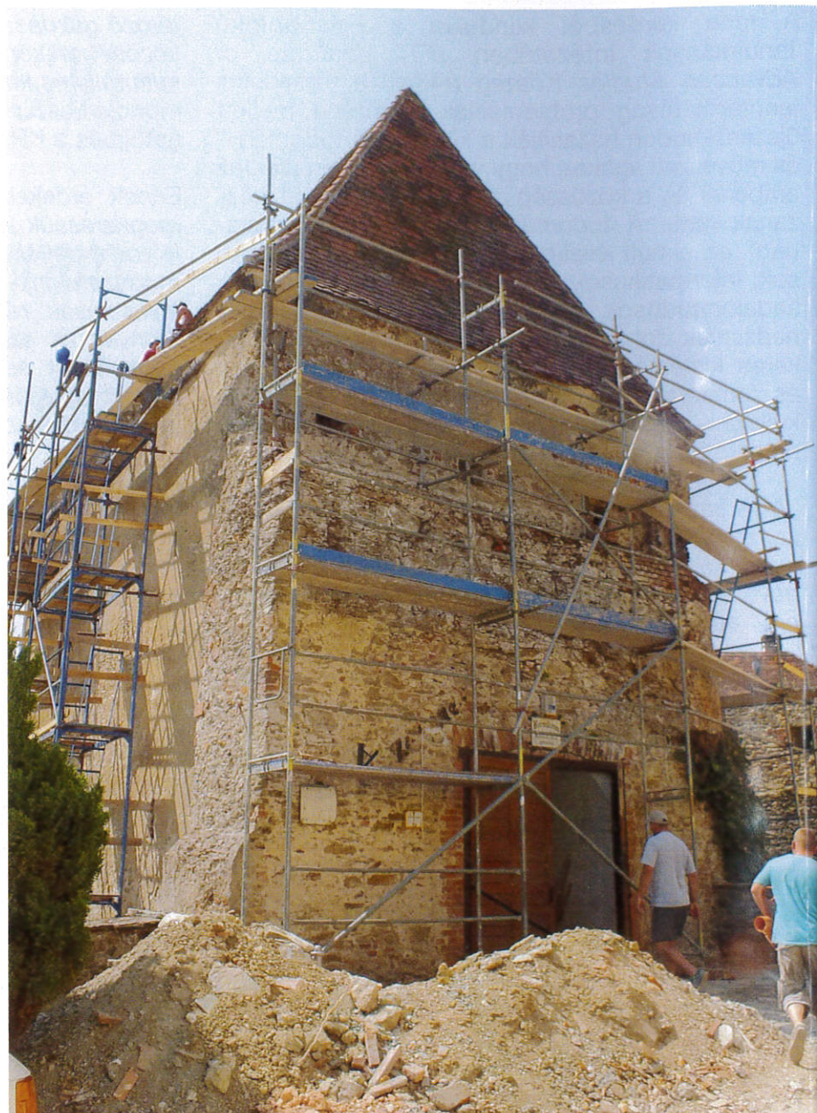
A kőszegi Zwingler-Öregtorony felújítása 2015 őszén fejeződött be. Itt kaptak helyet a Felsőbbfokú Tanulmányok Intézetének rendezvény és kiállító terei.

A kreatív város nem csak a tudományos élet feltételeinek megteremtését jelenti, legalább ugyanannyira fontos a kultúra, a sport, a kikapcsolódás egyéb formáinak mindennapokba történő szerves beépítése, minél szélesebb körű, változatosabb megjelenéseik elérése. Erre szükség van egyrészt a helyi lakosság életkörülményeinek javítása, magasabb szintre emelése miatt is, valamint az egyetemi szintű oktatás, kutatás helyszínének megteremtése miatt is: a tanításra felkérhető professzorok, a leendő hallgatók, a potenciális kutatók ezeket a szempon-