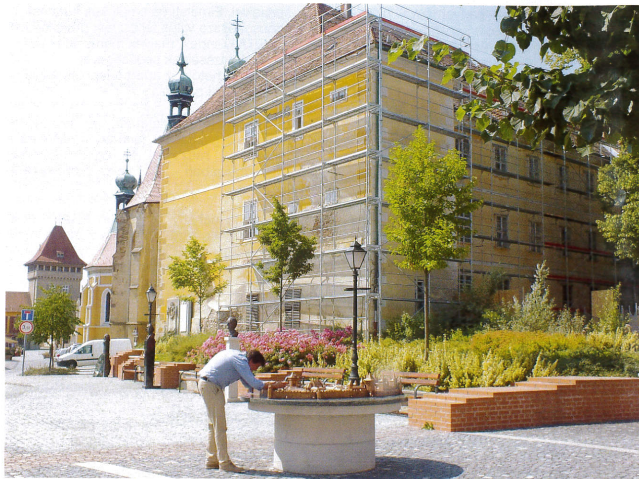
A Bencés rendház épület felújításának I. üteme 2016 tavaszán fejeződött be. A II. ütem 2017 második felétől folytatódik.