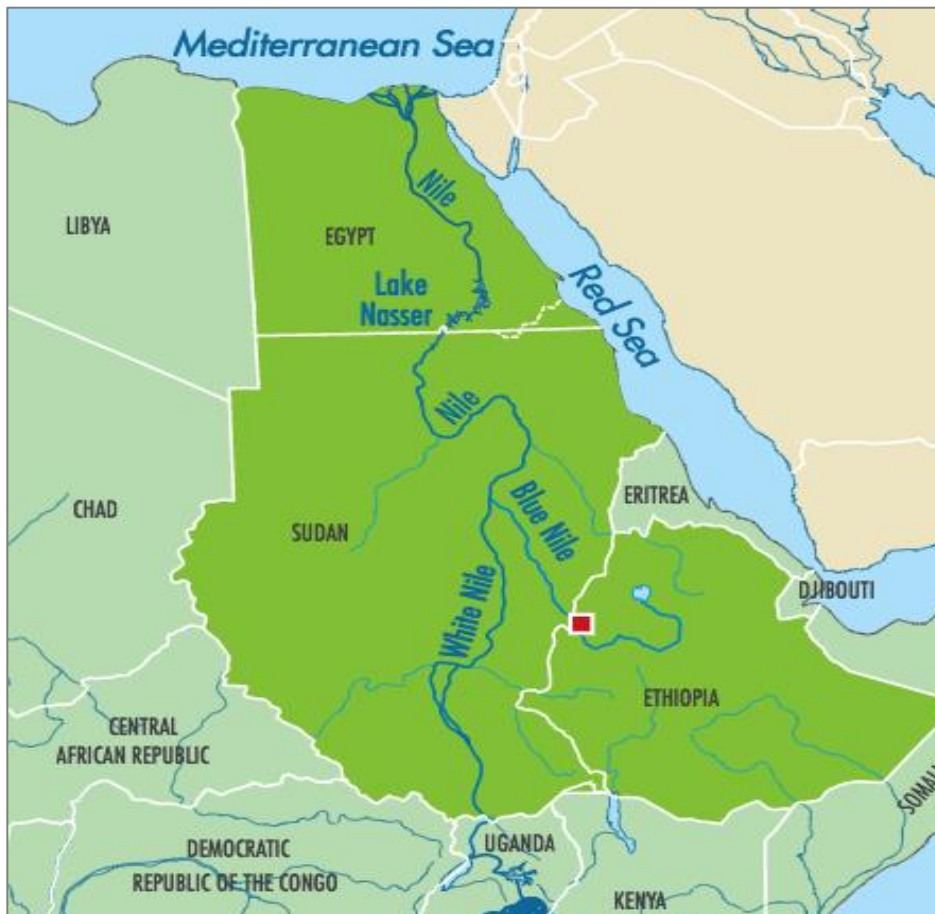
5. ábra. A Nílus vízgyűjtő ú.n. keleti medencéje. A piros négyzet jelzi a Nagy Etióp Reneszánsz Gátat (Motlagh 2017) Figure 5. The so called Eastern Basin of the Nile catchment. The red square indicates the location of Great Ethiopian Renaissance Dam (GERD) (Motlagh 2017)

ilyen hosszú feltöltés is a szudáni és egyiptomi mezőgazdasági vízigények kielégítését évekre veszélyeztetheti. Miután a GERD tervezett üzemeltetése az első feltöltés után beindul, a megnövelt tározótérfogat a folyórendszer felső folyása mentén természetesen pozitív hatással lehet majd Szudán és Egyiptom vízbiztonságára is, amennyiben a vízenergia generálás az öntözési igények időbeli változását figyelembe veszi.