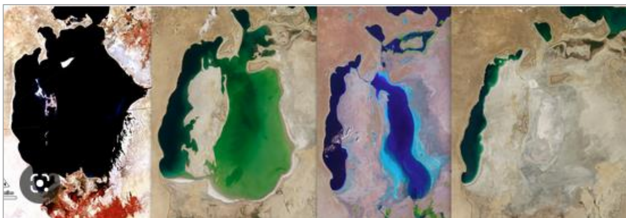
3. ábra. Az Aral tó agóniája 1960-tól napjainkig ( Wikipédia 2023b ) Figure 3. The agony of the Aral Sea from 1960 to the present day ( Wikipedia 2023b )

Mindez egy csapásra megváltozott, miután a közép-ázsiai köztársaságok az 1990-es évek elejétől függetlenné váltak. Az addigi energia cserekereskedelem megszűnt. A vízenergia-termeléssel járó vízleeresztések folytatódtak a vegetációs időszakon túl is. A befagyott folyók nem tudták a többlet vizet elvezetni. Így azt a Tianshan hegység lábánál egy sós depressziós medencébe kellett átvezetni, hogy a Szir-Darja lehetséges jeges árvizét elkerüljék. Így itt időközben létrejött a közel 4 000 km 2 nagyságú Aydar tórendszer, melynek változó, de néha több mint 30 km 3 -nyi vize természetesen szintén hiányzik az Aral-tóból ( Wikipédia 2023a ).