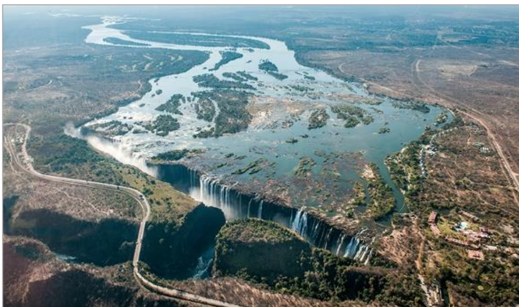
1. kép. A felhasadt Föld elnyeli a Zambézi. Victoria vízesés (Wikipédia 2023e) Photo 1. The split Earth swallows the Zambezi. Victoria Falls (Wikipedia 2023e)

Talán feltűnt a hallgatóságnak, hogy a Zambéziről beszélve – hogy úgy mondjam – „tűzbe jöttem”. Ennek egyik oka, hogy a Zambézihoz kötődő vízgazdálkodási kérdések engem az 1980-as évek első felétől kezdve foglalkoztatnak. A másik egy személyes meggyőződésem, hogy a Zambézi folyón található a világ legszebb pontját. A helyi nyelven „Dörgő Füst” néven ismert Victoria vízesés, amit ugyan nem repülőgépből, de 1984-ben módomban volt személyesen is látni, sok gondolatot ébreszthet az emberben, melyek az előadás elején említett, a vízgazdálkodásra is érvényes dimenziókhoz vezetnek.