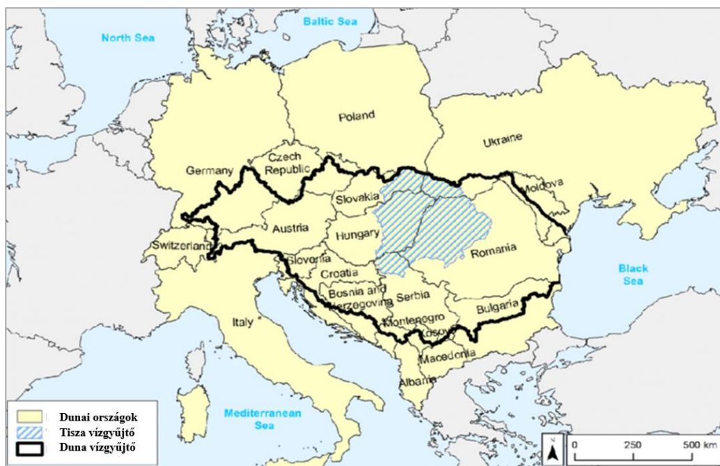
2. ábra. A világ legnemzetközibb folyama, a Duna (ICPDR) Figure 2. The world's most international river, the Danube (ICPDR)

Amikor kelet felé haladva a Dunához, a világ legnemzetközibb vízfolyásához érek, bizonyos fokig vissza kell fognom magamat. Bár a bölcsöm – vízimérnöki tekintetben is – a Duna partján ringott, annak, hogy ma 8 nemzetközi folyóról beszélhetek, melyekkel pályafutásom során szakmailag foglalkozhattam, magában rejti azt a tényt is, hogy számos, a hallgatóság soraiban ülő kollégával szemben a Duna-völgyi tapasztalataim messze nem elegendők ahhoz, hogy a Dunáról nekik valami újat mondjak. Ezért inkább az itteni munkák elismeréséről, illetve nemzetközi perspektívába helyezéséről lesz szó.