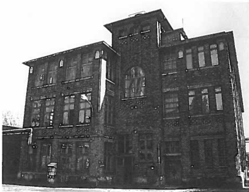
A KŐSZEGI NEMEZGYÁR ÉPÜLETE

A kreatív-innovatív térmegújítás, térhasználat kapcsán emlegetett „találkozások”, „kölcsonhatások” szükségessége a különféle ilyen tárgyú projektek vonatkozásában is fennáll.