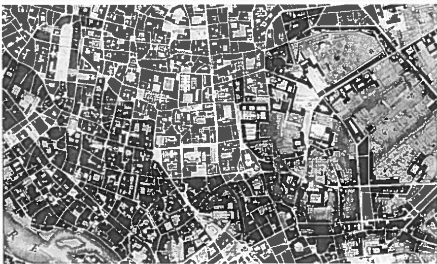
GIAMBATTISTA NOLLI TERKEPE RÓMA UTCÁIRÓL, TEREIRŐL, ÉS HÁZTÖMBJEIRŐL, 17.

Igy esett, hogy egy minden elemében újszerű intézet létrehozásának és elhelyezési feltételeinek, funkcióinak