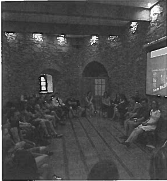
KRAFT KONFERENCIA, 2019