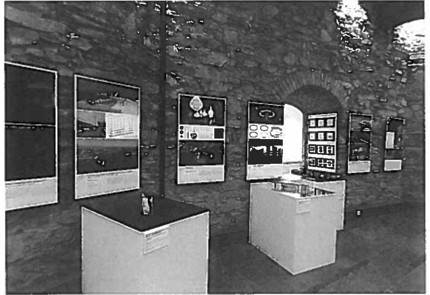
A II. ÉPÍTÉSZETI NEMZETI SZALDI KIÁLLÍTÁSA A KŐSZEGI ÖREGTÖRÖNYBEN

országon egyedülként állít elő gyapjútartalmú ruhaipari és műszaki nemezeket. A KIND, azaz Kőszeg Innovation in Design Unit vagyis Kőszegi Dizájn Innovációs Egység című projekt a KRAFT kistestvéreként a gyártáson kívül két projektelemmel, egy design múzeum létrehozásával és a gyártáshoz kapcsolódó fejlesztési-oktatási tevékenységgel tervezte a gyár felvirágoztatását, az épület és a tevékenység megmentését, munkalehetőséget teremtve az itt élőknek, turisztikai látványosságot biztosítva az ide látogatóknak. A megvalósítás a KRAFT Kőszeg második fázisában esedékes.