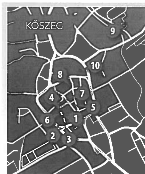
A KREATÍV VÁROS FENNTARTHATÓ VIDÉK (KRAFT) PROGRAM ELEMEI

A nemzetközi programok és a növekvő állandósuló érdeklődés napirenden tartotta a megfelelő szintű szálláshelyek és közösségi terek kérdését. Így nem ért minket felkészületlenül, hogy a KRAFT–Kőszeg program első körös elemeit két, egymást követő határozatban a kormány jóváhagyta. A 2014-es összefoglaló tanulmány tehát közel két évtized tapasztalatait és terveit foglalta keretbe és egészítette ki a KRAFT szempontjai szerint. A Magyar Építőművészet idei lapszámainak „Kreatív városok” rovatában bemutatott tíz épület és városrész tehát egy funkcióiban sok szálon kötődő épületegyüttes,