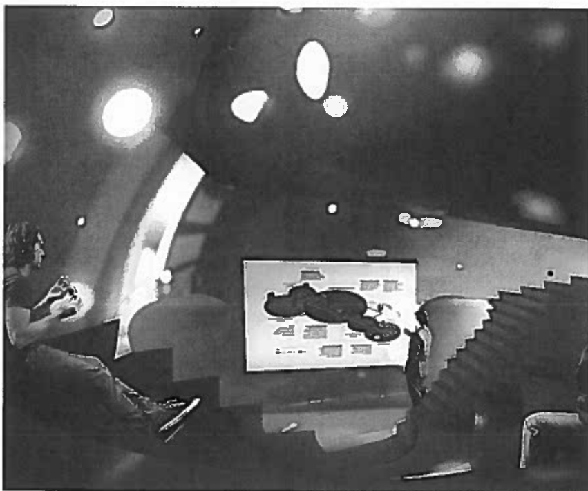
SZEMINÁRIUMI TEREM AZ EKLER DEZSŐ ÁLTAL TERVEZETT KUTATÓINTÉZET "GÖMBJÉGI

A történeti terek létrehozásakor uralkodó elvárásokkal szemben a mai terek kialakításánál fontos szerepe van a gyors és könnyű átalakíthatóságnak. A térszervezésben, ugyanúgy, mint a 21. században minden területen, nagyon fontos a gyors alkalmazkodás a felmerülő igényekhez, a rugalmasság felértékelődik a tér