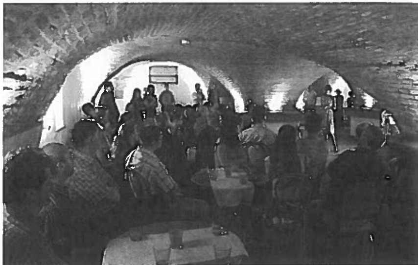
ELŐADÁS A KŐSZEGI EURÓPA HÁZ PINCELÉJÉN