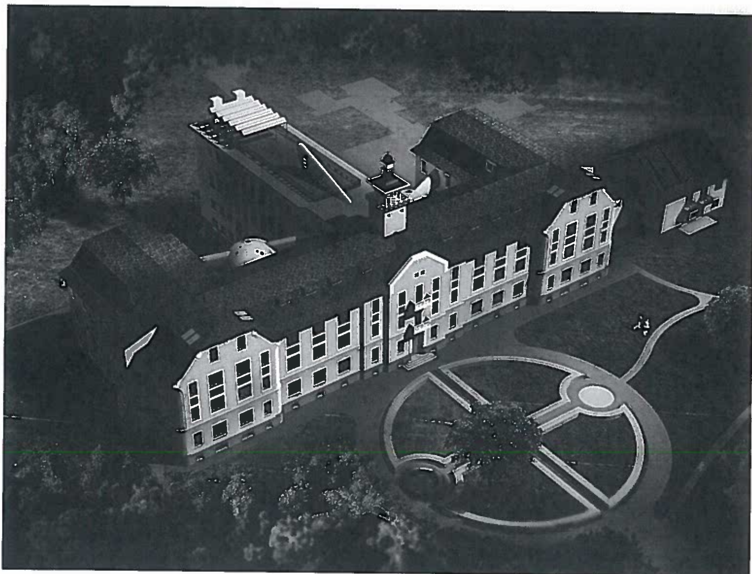
A KÖZTÉRKÖZPONT LÁTÁNYTERVE

érzékenységgel alkalmazza az illeszkedés, illetve a kontraszt eszközeit. Tisztelettel nyúl a meglévőhöz, és teszi azt az elfogódottság nélkül alkalmazott kortárs hozzáadatokkal alkalmassá a minőségileg más, kreatív funkcióra.