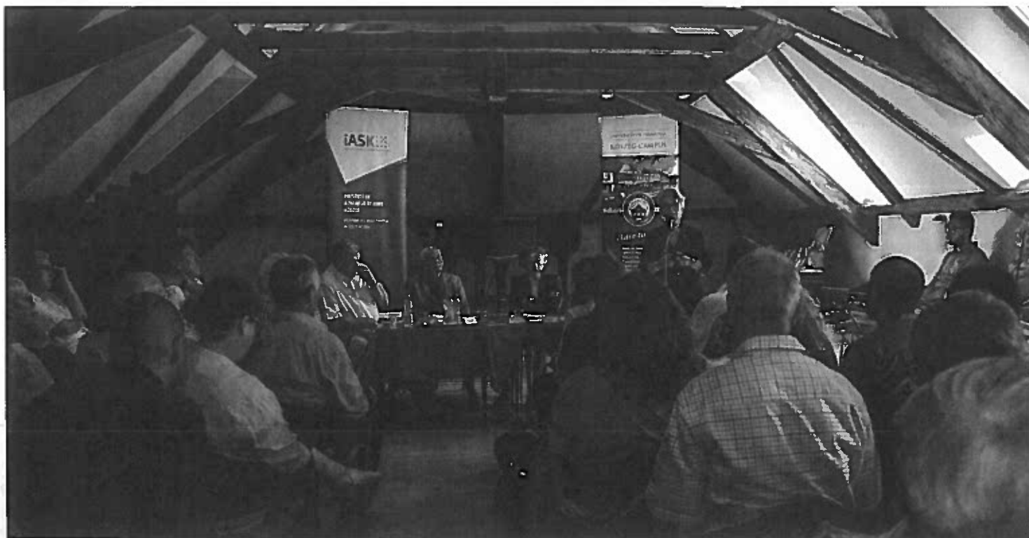
TETŐTÉR ELŐADÓTEREM A KŐSZEGI EURÓPA HÁZBAN

One of the goals of redesigning historic spaces is to make cooperation easier, create communities and initiate spontaneous meetings. This kind of space design is not only targeted to meet a certain type of direct functional needs, but also to reframe community and social life as well as to reframe corporate and organisational culture. Inspiring spaces are physical manifestations of economic, social and cultural forces. The changing nature of innovation changes spaces into open flexible venues, where various professions and branches of science can easily approach each other. Incubator houses, innovation centres, new research institutes tend to appear as the cradles of the innovation process supporting versatile activities in various locations. They reinforce the interactions and cooperation between people and their groups, which is the reason why their spaces tend to be open, transparent and inviting, opening up new ways in communication and sharing, offering opportunities to consciously reconsider the activities to be expected that is a wide variety of events and happenings.